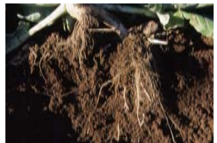
堆肥の大きな働き 根づくり効果